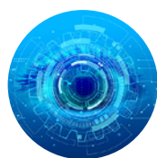
双目立体视觉技术